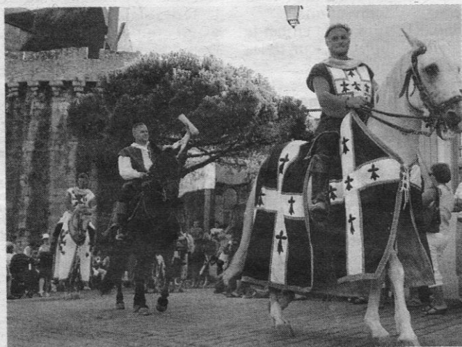
Les chevaliers s'affrontent et paraden le temps d'un week-end.