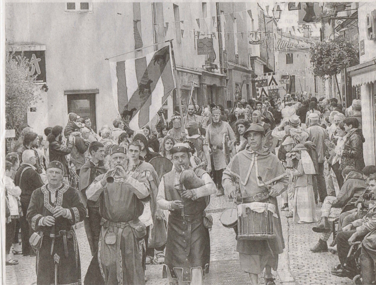
Devant des milliers de spectateurs enthousiastes, le défilé des artistes et des bénévoles costumés a clôturé de magnifique façon les 15 e Médiévales de Clisson.