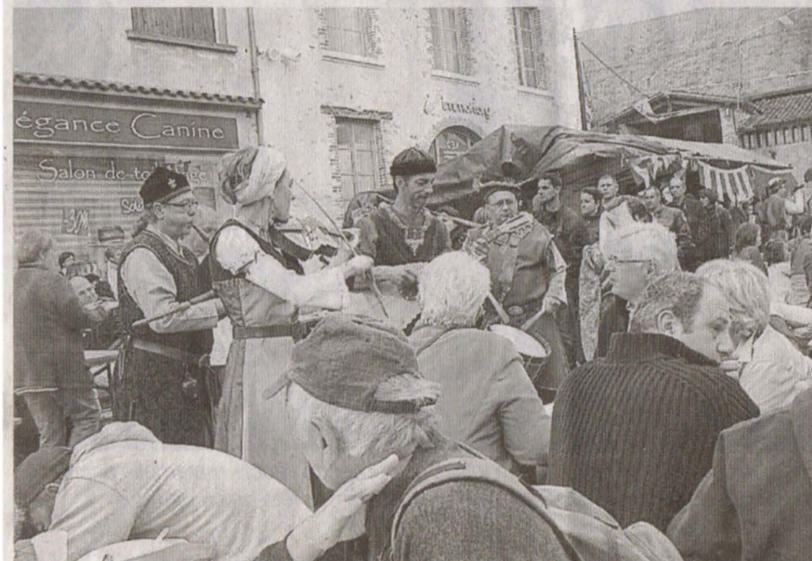
Les musiciens de la compagnie Elixir ont animé les ripailles du samedi soir.